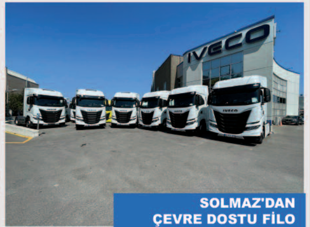
SOLMAZ'DAN ÇEVRE DOSTU FİLO