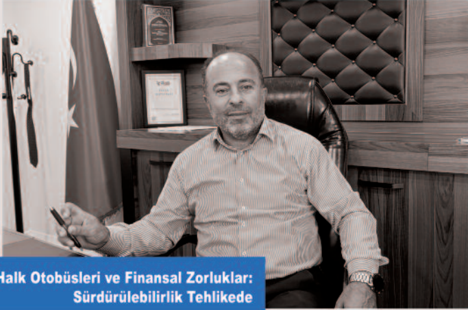
Halk Otobüsleri ve Finansal Zorluklar: Sürdürülebilirlik Tehlikede