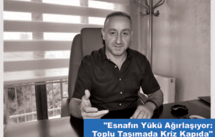
"Esnafın Yüğü Ağırlaşıyor: Toplu Taşımada Kriz Kapıda"