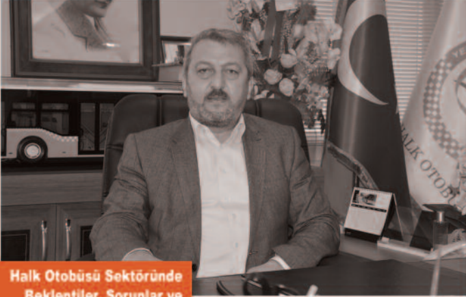
Halk Otobüsü Sektöründe Beklentiler, Sorunlar ve Çözüm Yolları