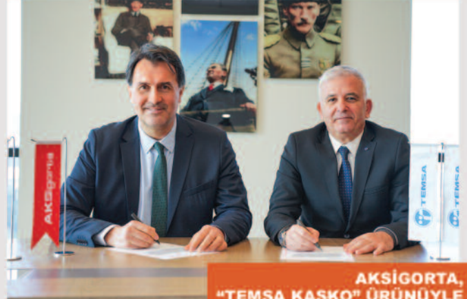
AKSİGORTA, "TEMSA KASKO" ÜRÜNÜYLE AYRICALIKLAR SUNUYOR