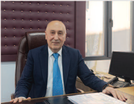
Kontak Kapatma Kararının Ardındaki Gerçekler ve Esnafın Talepleri