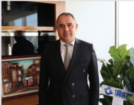
ÖZEL HALK OTOBÜSÜNDE GÜNCEL SORUNLAR