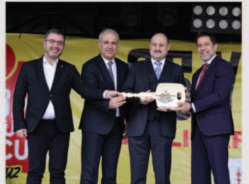
Anadolu Isuzu'dan Şanlıurfa Belediyesi'ne 25 adet Citiport