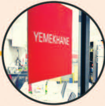
MÜŞTERİ İKRAM ODAMIZ