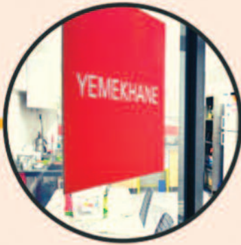
MÜŞTERİ İKRAM ODAMIZ