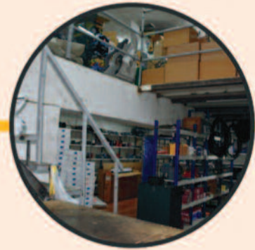
YEDEK PARÇA STOKU

Anadolu Isuzu Otobüsleri yetkili servis hizmet noktası UYGUN OTOMOTİV, tüm otobüs markalarını kaliteli hizmet ile buluşturuyor.